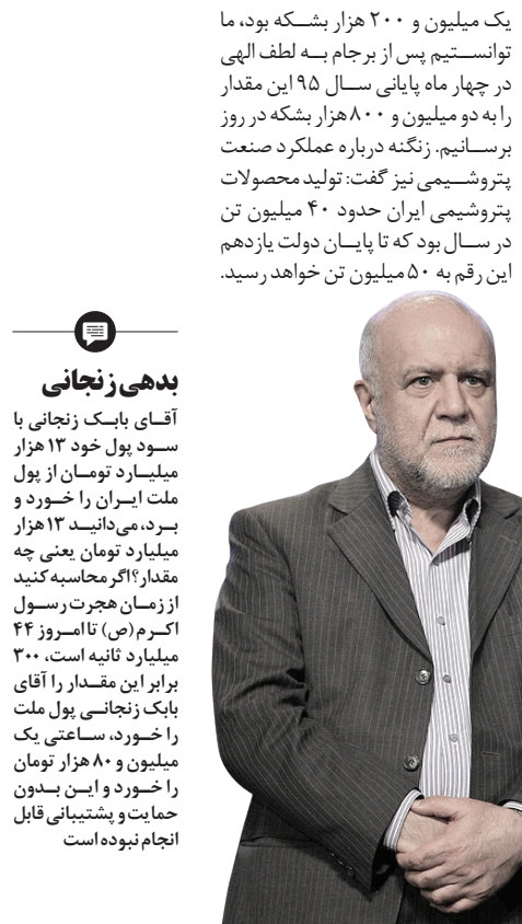
بدهی زنجان‌ی آقای بایک زنجان‌ی با سود پول خود ۱۳ هزار میلیارد تومان از پول ملت ایران را خورد و برد، می‌داند ۱۳ هزار میلیارد تومان یعنی چه مقدار؟ اگر محاسبه کنید از زمان هجرت رسول اکرم (ص) تا امروز ۴۴ میلیارد ثانیه است. ۳۰۰ برابر این مقدار را آقای بایک زنجان‌ی پول ملت را خورد، ساعتی یک میلیون و ۸۰ هزار تومان را خورد و این بدون حمایت و پشتیبانی قابل انجام نبوده است

وی افزود: برداشت گاز ما از پارس جنوبی پیش از دولت یازدهم، کمتر از نصف حجم برداشت قطر بود، اما هم‌اکنون با وارد مدار کردن ۱۱ فاز پارس جنوبی که توسعه هر فاز آن به پنج تا ۶ میلیارد دلار هزینه نیاز دارد، ما توانستیم تولید گاز خود را به قطر برسانیم. زنگنه تصریح کرد: برداشت نفت خام ایران از میدان‌های مشترک با عراق در سال ۹۱ روزانه حدود ۷۰ هزار بشکه بود که ما با تلاش زیاد و افزایش چهار برابری این مقدار را به ۲۸۰ هزار بشکه رساندیم. وی عنوان کرد: صادرات نفت خام ایران در زمان آغاز به کار دولت یازدهم، روزانه