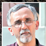
از تباط اصلاح طلبان و دولت