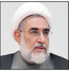
رسول منتجب نیا

قانون مربوط به فعالیت احزاب به لحاظ اینکه در دوره اول به تصویب رسیده بود و سال‌های متمادی از عمر آن گذشته بود، نیاز به بازنگری و تکمیل داشت. در این مساله جای تردیدی نبوده است چون قوانین تصویب مجلس هر از گاهی باید مورد بازنگری و دقت مجدد قرار بگیرد تا اشکال‌هایی که در عمل مشاهده می‌شود از آن قوانین بر طرف شود. این قانون در مجالس گذشته مورد بحث واقع شده بود و حتی در مجلس دهم به تصویب نرسیده است. قانون جدید احزاب در مجالس هشتم و نهم که مجلس‌های مطلوبی نبوده به تصویب رسیده و تا حدی حتی مطلوبیت فعلی مجلس نیز در آن وجود نداشته است. فکر نمی‌کنم بازنگری با اصلاح‌طلبان قانون با رویکرد تقویت میدان دادن به احزاب صورت گرفته باشد. چرا که در فضایی تصویب شده که بسیاری از نمایندگان با گسترش دموکراسی و تحزب موافق نبوده‌اند، باید به این قانون پادیده تردید نگاه کرد. آای بشود که این قانون در مجلس دهم مورد بازنگری مجدد قرار بگیرد، بهتر است. شنیده شده که برخی