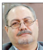
سیدمسعود رضوی فقیه