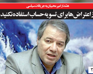
هدایا بر مبنای به‌جرات سیاسی

از اعتراض‌ها برای تسویه حساب استفاده نکنید