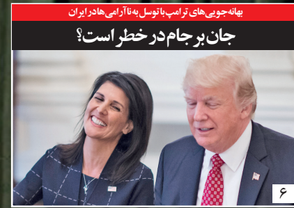
جان پر جام در خطر است؟