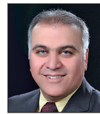
مهررداد پاشنگ پور

سخنان نیکه هیلی، نماینده دائم ایالات متحده امریکا در سازمان ملل متحد مبنی بر ارجاع پرونده حوادث اخیر در ایران به جلسه اضطراری شورای امنیت سازمان ملل متحد با توجه به جایگاه ایشان هم از حیث حقوقی و البته از منظر سیاسی بسیار عجیب و واجد بلاهتی بود که در کمتر از یک ماه برای مرتبه دوم از ایشان مشاهده می شود. قدرتی در جهان، لازمه حیاتی این رویکرد است. تنها با چنین نگاهی است که می توان سرمایه ها و امکانات گسترده کشورمان را در میدان بدهبستان جهانی نقد کرد و چالش های پیش رو را به ابزار و فرصتی برای حل مشکلات اجتماعی، اشتغال زایی و رشد اقتصادی کشورمان مبدل کرد. مسوولان نظام، بر هر مسند قدرتی، در هر جناحی و با هر ملاحظه و نگاهی، چنانچه آموزه های ذاتی اعتراضات اخیر را پشت گوش انداخته و همچنان در گیر قهرها و اختلافاتی مناسبانه حل نشده تا امروز، راهی نو برای یکپارچه و همسو کردن مصلحت اندیشی هایی بر سر شکوفایی اقتصادمان، سیاستمان و امیدآفرینی برای جوانان مان پیدا نکنند، چه بسا به نوعی در همان کژراهه رسانه ملی مان باشند.