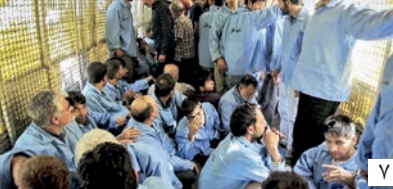
توقف اعدام ۴ هزار محکوم مواد مخدر

زن در مدل اسلامی ۱۷ دی سالروز کشف حجاب توسط رضاخان است. رضاخان به پیروی از آتاترک در ترکیه، به خیال فرنگی کردن ایران اقدام به این کار کرد. او فکر می کرد پیشرفت اروپایی ها در صنعت و نظام اجتماعی ناشی از بی حجاب شدن زنان اروپاست که سالها قبل از آن آنها هم از پوشش مناسبی برخوردار بودند. البته وضعیت زنان ایرانی در دوره رضاخان وضع مورد نظر اسلام نبود، چرا که اکثر قریب به اتفاق آنها پرده نشین بودند و استعدادهای انسانی آنها شکوفانی شد و نقش مستقیمی در ساختن جامعه و تاریخ نداشتند اگرچه نقش غیر مستقیم زن از راه تأثیری که بر مرد دارد همیشه وجود داشته است. اصلاح آن وضع، کشف حجاب نبود بلکه همان راه اسلام بود یعنی ایجاد فضای مناسب برای تحصیل و ورود بانوان به جامعه، تا ضمن عمل به تعهدات خود در خانواده و وظیفه مادری نیروی کار و تولید جامعه را افزایش دهند و این امر بار عایت پوشش اسلامی و حریم میان زن و مرد بیگانه قابل تحقق بود. اما رضاخان چشم بسته به سوی فرهنگ غربی ادامه در صفحه ۰۹ رفت و از نیروی روحانیت در ایران و عواطف مذهبی مردم غافل بود. لذا با مقاومت شدید مردم مواجه شد که اوچ آن فاجعه کشتار معترضان در مسجد گوهرشاد مشهود بود.