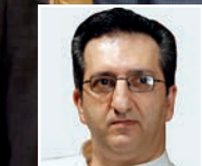
صف آرای ناکزیر طبقاتی