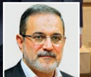
آزادی ۱۵ دانش آموز بازداشتی