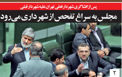
پس از امضای شورای فنی تهران علیه شهراد قلبی

تعلیق روابط خارجی در پیشاب جام بهرام قاسمی - ۶