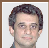
تحلیل وضعیت ترامپ فرید مرچایی - ۵