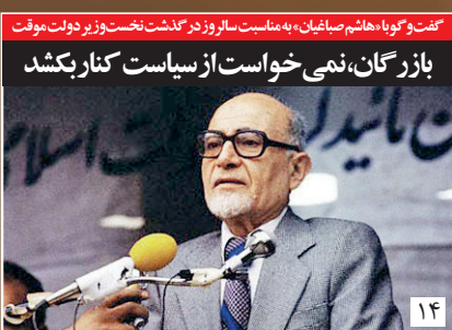
کتاب و گوایه هاشم صابزجان، به سلسله ساروز در گذشت نخست وزیر دولت بوقت بازرگان، نمی خواست از سیاست کنار بکشد