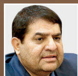
هزار امین مدرسه بنیاد برکت محمد مخبر - ۷